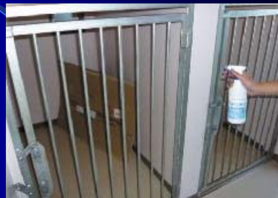
日常の消臭・除菌の業務に パルボ・アデノウィルスの 予防