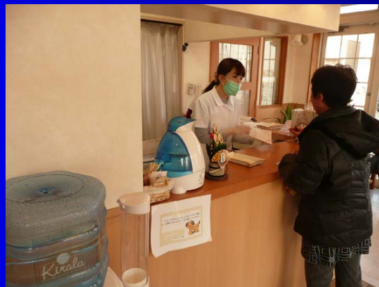
病院(待合室)内での噴霧 感染対策・動物臭の除去