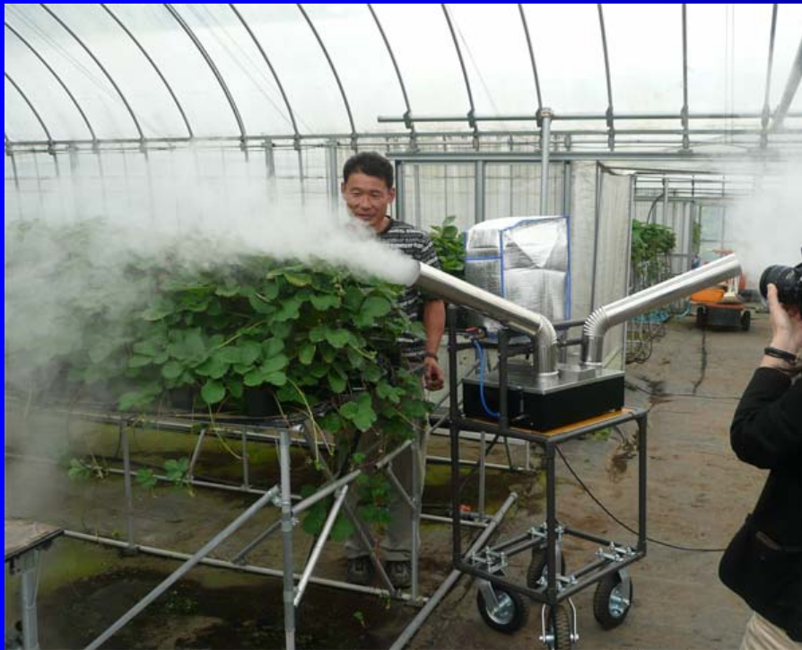
超音波煙霧機での噴霧風景