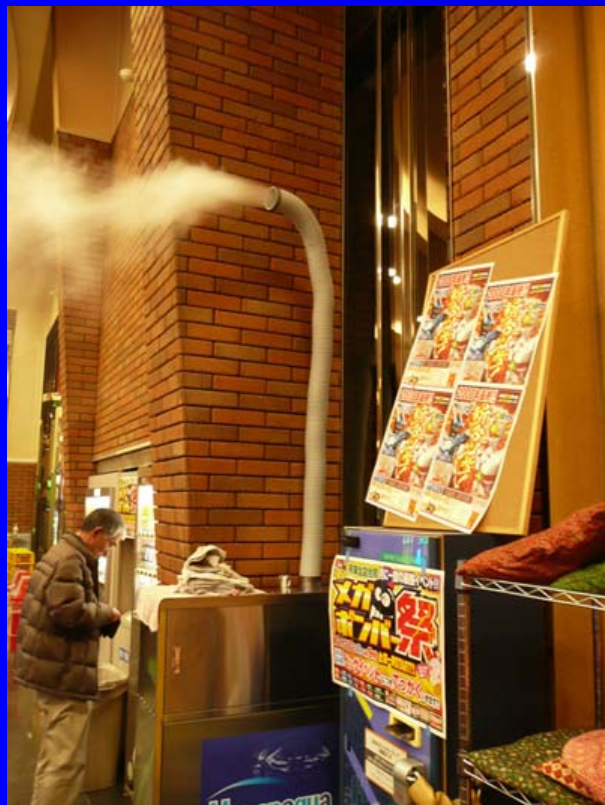
店舗内で超音波煙霧機噴霧